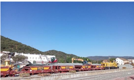
Carga de convoy de balasto