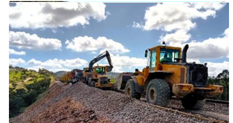
Extendido de balasto