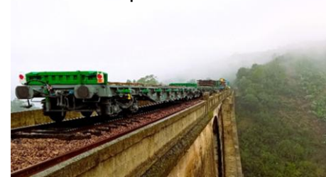
Transporte de carril