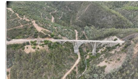
Actuación de reparación en puente