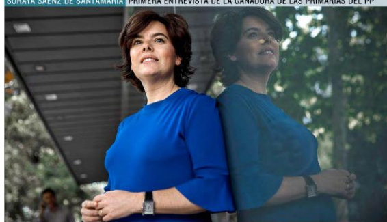
La ex vicepresidenta del Gobierno, ayer, en la sede del Partido Popular en la calle Génova de Madrid, tras su victoria en las primarias del jueves.

SORAYA SÁENZ DE SANTAMARÍA PRIMERA ENTREVISTA DE LA GANADORA DE LAS PRIMARIAS DEL PP