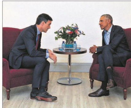
ENCUENTRO FUGAZ ENTRE SÁNCHEZ Y OBAMA. El presidente del Gobierno, Pedro Sánchez, mantuvo ayer un breve encuentro, de unos 15 minutos, con el expresidente de Estados Unidos Barack Obama. El mandatario estaba en Madrid para participar en un foro sobre cambio climático. Página 40

+ El valor de estar más informado Tu suscripción desde 9,90 euros al mes. suscripciones.elpais.com