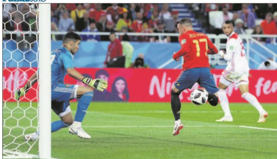
Iago Aspas marca de tacaón el gol que le dio a España el empate (2-2) ante Marruecos en los instantes finales del partido.