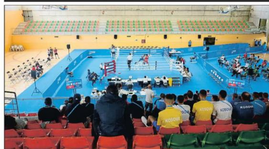
Gradas casi vacías en Tarragona. Como ocurrirá el viernes con la polémica ceremonia de apertura, los Juegos Mediterráneos no despiertan el interés del público, que apenas acude a presenciar las diferentes competiciones. VIVIR 1

► El compromiso pide al Gobierno cambios para controlar la subcontratación ECONOMÍA 47