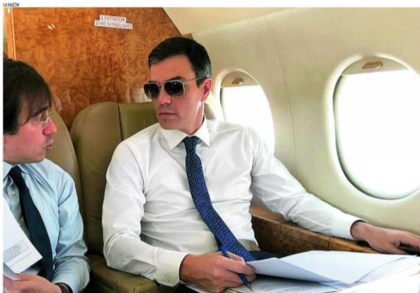
ESTRENO EN BRUSELAS. El presidente prepara en el «falco» la Cumbre que consideró «un paso adelante». En su compañía, contestó en español y en inglés

El partido prefiere una lista de integración, aunque ningún precandidato se ha pronunciado