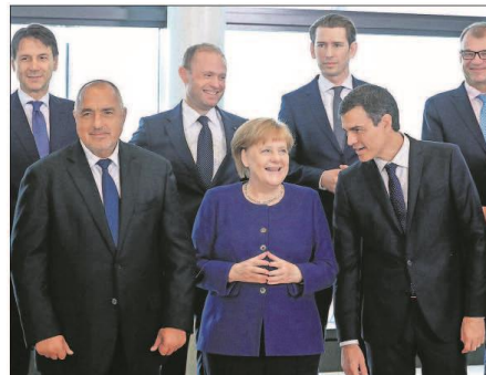
Desde la izquierda, los jefes de Gobierno de Italia, Giuseppe Conte; Bulgaria, Boiko Borisov; Malta, Joseph Muscat; Alemania, Angela Merkel; Austria, Sebastian Kurz; España, Pedro Sánchez, y Finlandia, Juha Sipilä, ayer en la minicumbre celebrada en Bruselas.

www.elpais.com EL PERIÓDICO GLOBAL LUNES 25 DE JUNIO DE 2018 | Año XLIII | Número 14.959 | EDICIÓN NACIONAL | Precio: 1,20 euros