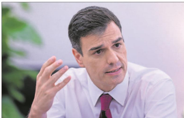
Pedro Sánchez, el viernes, durante la entrevista realizada en el Palacio de la Moncloa.

mo la ley de la eutanasia o el traslado de los restos de Franco del Valle de los Caídos. Sánchez deja clara su vocación europeísta, su intención de recuperar influencia en Europa y su decisión de normalizar las relaciones con la Generalitat de Cataluña. Páginas 27 y 20