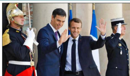
Emmanuel Macron y Pedro Sánchez, ayer, saliendo en el palacio del Eliseo de París.