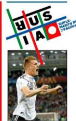
Kroos celebra su primer gol de la victoria de Alemania.