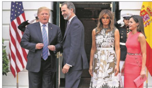
LOS REYES VISITAN A TRUMP EN LA CASA BLANCA. Los Reyes de España se reunieron ayer con Donald Trump en el último día de su viaje a EE.UU. En la imagen, Don Felipe y Doña Letizia, con Trump y su esposa Melania en la Casa Blanca.