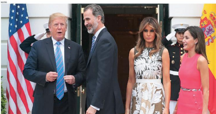
TRUMP, A LOS REYES EN LA CASA BLANCA: «IRÉ A ESPAÑA»

El matrimonio Trump recibió ayer en la Casa Blanca a los Reyes Felipe y Letizia en un cordial encuentro en el que el máximo mandatario americano expresó su deseo de visitar de nuevo España y remarcó, en tono tranquilizador, las «excelentes relaciones comerciales» entre ambos países. P. 16