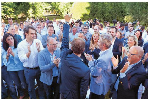
Núñez Feijóo aseguró que no puede «fallar a los gallegos porque sería fallarme a mí mismo»

A LA ESPERA DE LAS CANDIDATURAS DE COSPEDAL Y SANTAMARÍA