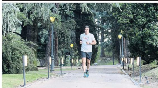
Entrenamiento en los jardines del palacio. Sánchez lleva algo más de dos semanas residiendo en la Moncloa, pero se le había visto a poco. Ayer se distribuyeron fotos suyas corriendo por el recinto y por la noche fue entrevistado en TVE

Urdangarín ingresa en Brieva, la cárcel en la que estuvo Roldán