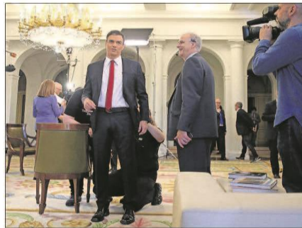
Pedro Sánchez se prepara anoche para la entrevista en el palacio de La Moncloa.

MARTES 19 DE JUNIO DE 2018 | Año XLIII | Número 14.953 | EDICIÓN NACIONAL | Precio: 1,50 euros