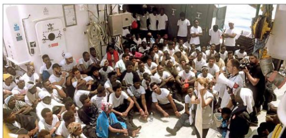
Una voluntaria de Médicos Sin Fronteras se dirige, ayer, a los 629 inmigrantes en la cubierta del barco 'Aquarius'.