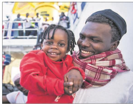
Dos de los migrantes rescatados por el buque, en la cubierta del Aquarius.