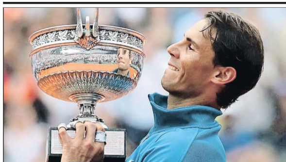
El rey de París. Rafa Nadal volvió a superar un récord y conquistó su undécimo Roland Garros en la capital mundial de la tierra batida, imponiéndose con facilidad al austriaco Dominic Thiem en tres contundentes sets (6-4, 6-3, 6-2). DEPORTES 44 & 46

Si el Govern iniciara ya la cuenta atrás para aprobar los presupuestos de la Generalitat para este año 2018, llegaría a tenerlos en vigor entrado el mes de noviembre. Por ello el vicepresidente y conseller d'Economia, Pere Aragonès, prepara ya los del 2019. ECONOMÍA 55