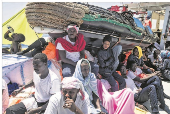
Un grupo de subsaharianos, ayer en la cubierta del Aquarius tras ser rescatados por su tripulación.

nal Trump, insultara públicamente al primer ministro de Canadá, al que llamó "debil" y "deshecho". Francia y Alemania han mostrado su hartazgo ante la política neerlandesa de Trump, que acusó al mundo entero de robar a EE UU y dejó en el último momento separar del comunicado conjunto de la cumbre las críticas canadienses a su giro proteccionista. Página 4