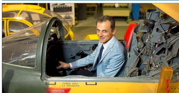
Pedro Duque, en la Escuela de Ingenieros Aeronáuticos de la Universidad Politécnica de Madrid, en la que estudió, el sábado pasado.