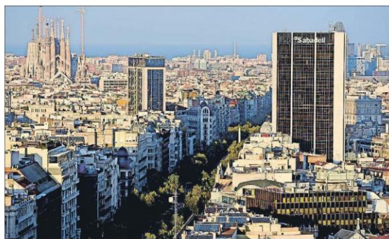
Paisaje financiero. El emblemático edificio de Banc Sabadell en la Diagonal barcelonesa forma parte del eje económico de la capital catalana. En un extremo de la avenida se sitúan las dos torres negras de La Caixa. ECONOMÍA 58 A 64 Y EDITORIAL

► Puigdemont y Junqueras evitaron evaluar ayer la salida de las entidades