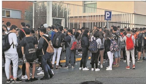
EN DEFENSA DE LOS COMPAÑEROS HUMILLADOS. Dociientos alumnos del instituto El Palau, en Barcelona, se concentraron ayer para exigir respeto hacia sus compañeros hijos de guardias civiles. El lunes, dos profesores de este centro señalaron a varios chicos por las cargas policíacas del referéndum. "Estáis contentos con lo que hizo tu padre ayer", le dijeron a uno. "La Guardia Civil solo sabe dar palos", le espetaron a otro. P. 17

en Palma de Mallorca, según fuentes de la entidad. Finalmente, el Consejo de Ministros aprobará un real decreto que permitiría este cambio de sede sin necesidad de convocar la junta de accionistas. Página 14 a 23 y 46 a 49