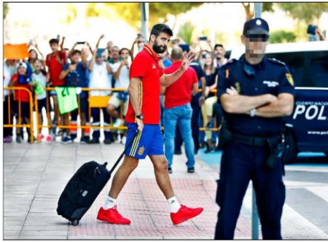
PÁGINA 41 Y 8

Alicante, en el foco de la actualidad económica, política y deportiva. El Banco Sabadell dejó ayer Barcelona para irse a esa ciudad, el mismo lugar donde aterrizó la selección española de fútbol, con Piqué en la imagen en el ojo del huracán. El defensa fue recibido con pitos y aplausos a su llegada al hotel (los jugadores accedieron por una entrada secundaria) y en el posterior entrenamiento en el estadio Rívior Pérez. Hoy será titular ante Albania.