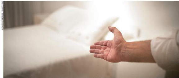
LOS CATALANES QUE DEJAN SUS CASAS A LA GUARDIA CIVIL. Ofrecen hospedaje a agentes, pero temen dar la cara por el acoso soberanista

Banco Sabadell traslada su sede social a Alicante y el consejo de CaixaBank se reúne hoy para valorarlo • Las dos entidades suben en la Bolsa tras el anuncio • El Gobierno prepara un decreto para facilitar la salida exprés de las sociedades P22