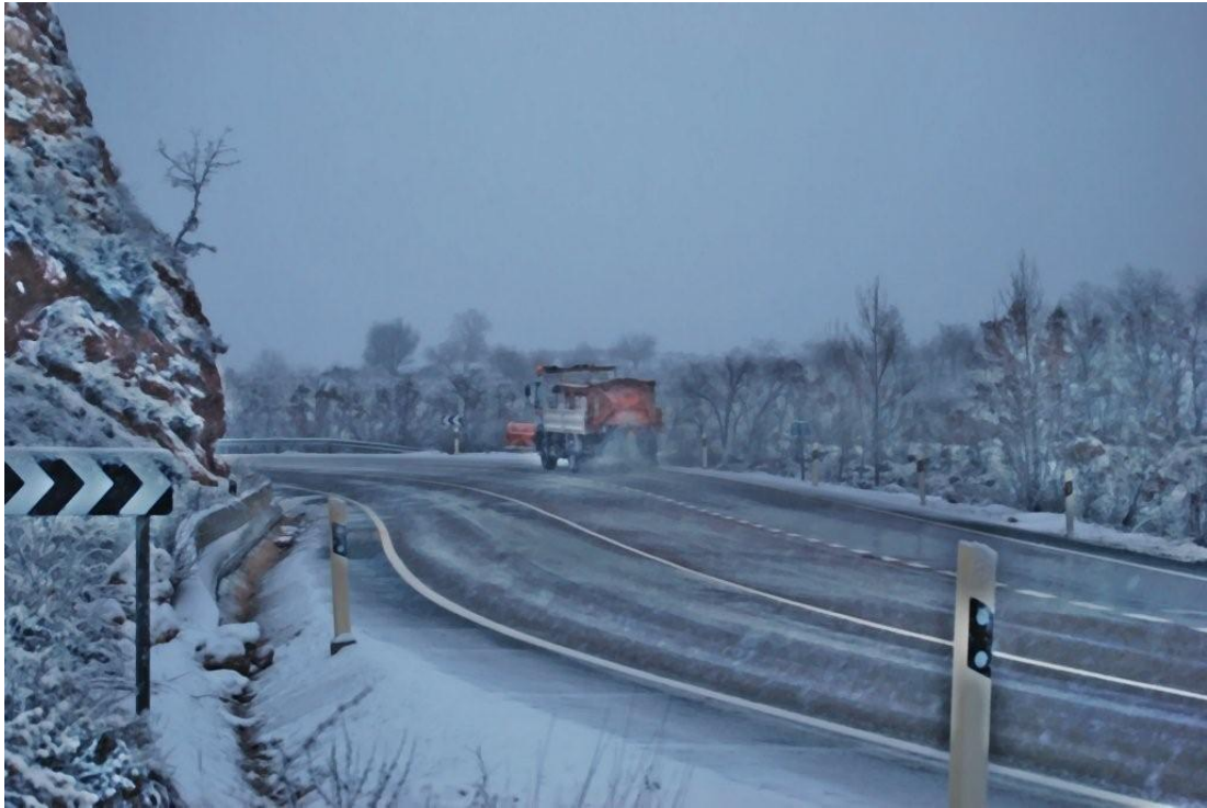
N-204 Pk 61 - Trabajos de vialidad invernal