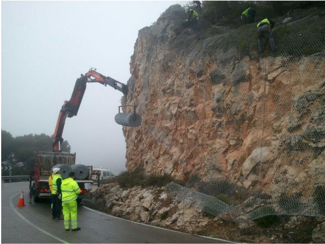
N-320 Pk 225 - Instalación de malla de protección en talud