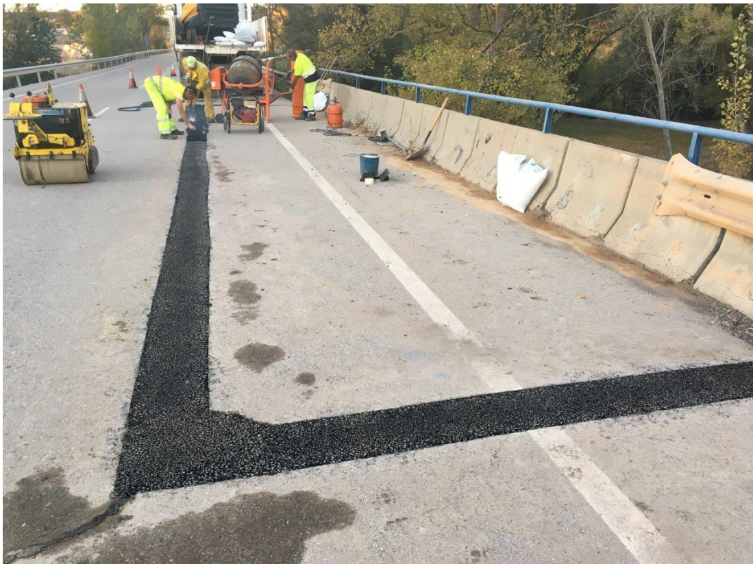
N-204 Pk 54 - Construcción de junta de dilatación