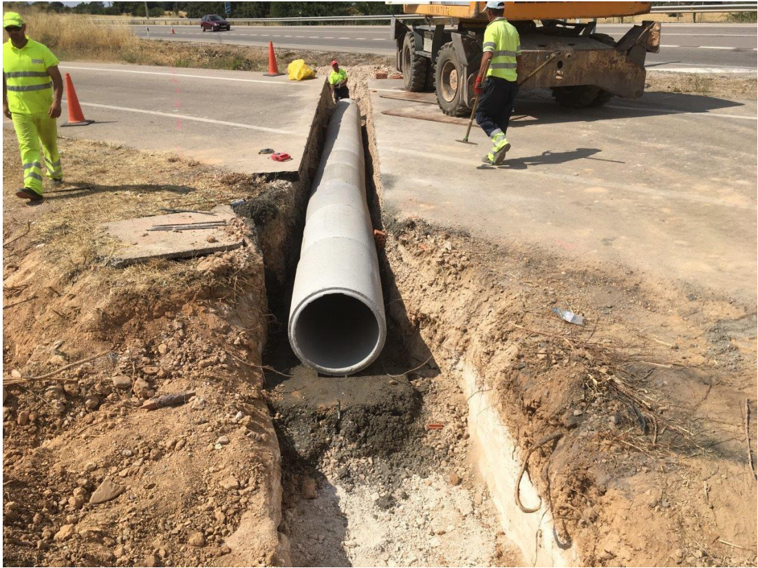
N-320 Pk 267 - Ejecución de obra de drenaje transversal