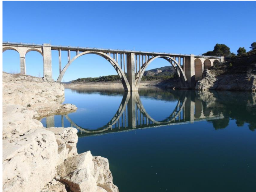
N-204 Pk 19 - Viaducto de Entrepeñas