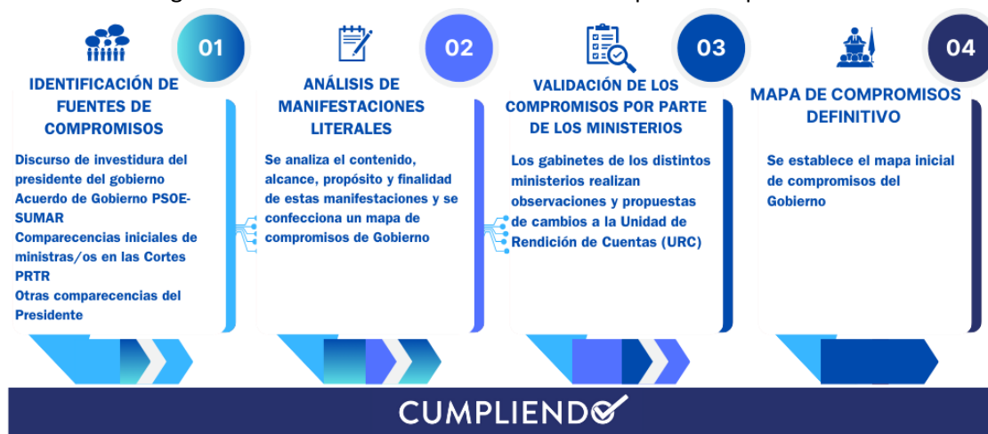
Figura Cuatro. Proceso de elaboración del mapa de compromisos