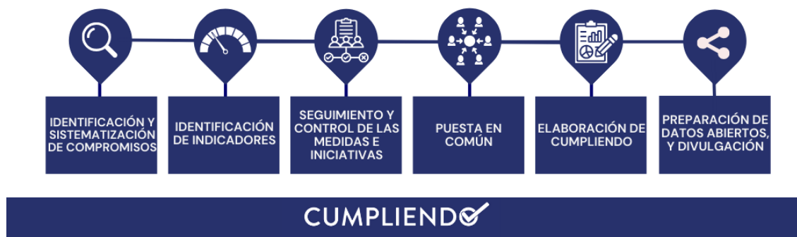
Figura Uno. Proceso de elaboración de la rendición de cuentas Cumpliendo

Partiendo de esta definición, a efectos del presente ejercicio de rendición de cuentas, un compromiso es todo aquel pronunciamiento, obligación, promesa, manifestación o conjunto de las anteriores expresada por el Gobierno o sus integrantes de forma explícita, con el fin de responder ante una necesidad o problema público específico y, en cierta medida, trasladar una voluntad de transformar la realidad de una determinada manera. Un compromiso genera, por tanto, una expectativa en un tercero o terceros y, como contrapartida, una responsabilidad y obligación de respuesta por parte del Gobierno que se materializa en un proceso formal, en el que la actuación puede ser sometida a juicio de la ciudadanía.