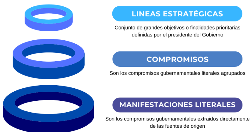
Figura Tres. Identificación de compromisos.

Frente al elevado número de compromisos de la rendición de la anterior legislatura, este proceso permite: