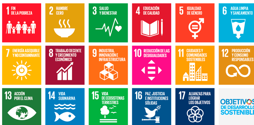
Figura Siete. Objetivos ODS

Por su parte, la COFOG es una clasificación estandarizada y consolidada a nivel internacional, que permite estructurar los compromisos en base a los ámbitos de la realidad en los que operan: