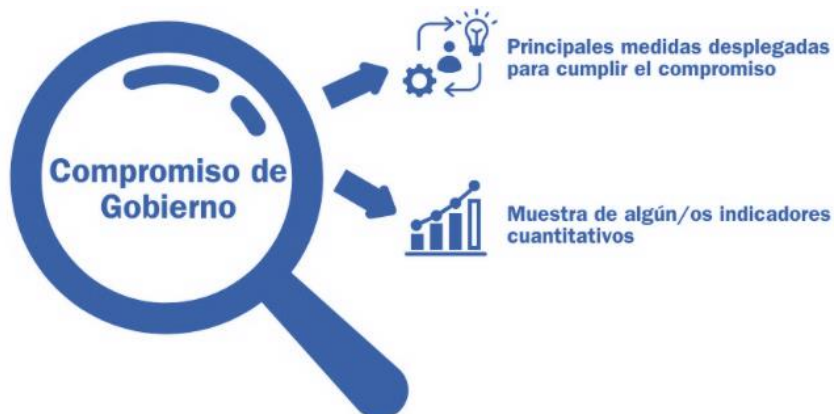
Figura Cinco. Aproximación a los compromisos.

La rendición de cuentas incorpora la cadena de resultados, herramienta lógica de amplio uso tanto en el diseño como en el análisis y evaluación de políticas públicas: el compromiso constituiría la finalidad u objetivo perseguido, mientras que las medidas e iniciativas son las medidas diseñadas e implementadas para obtener unos resultados.