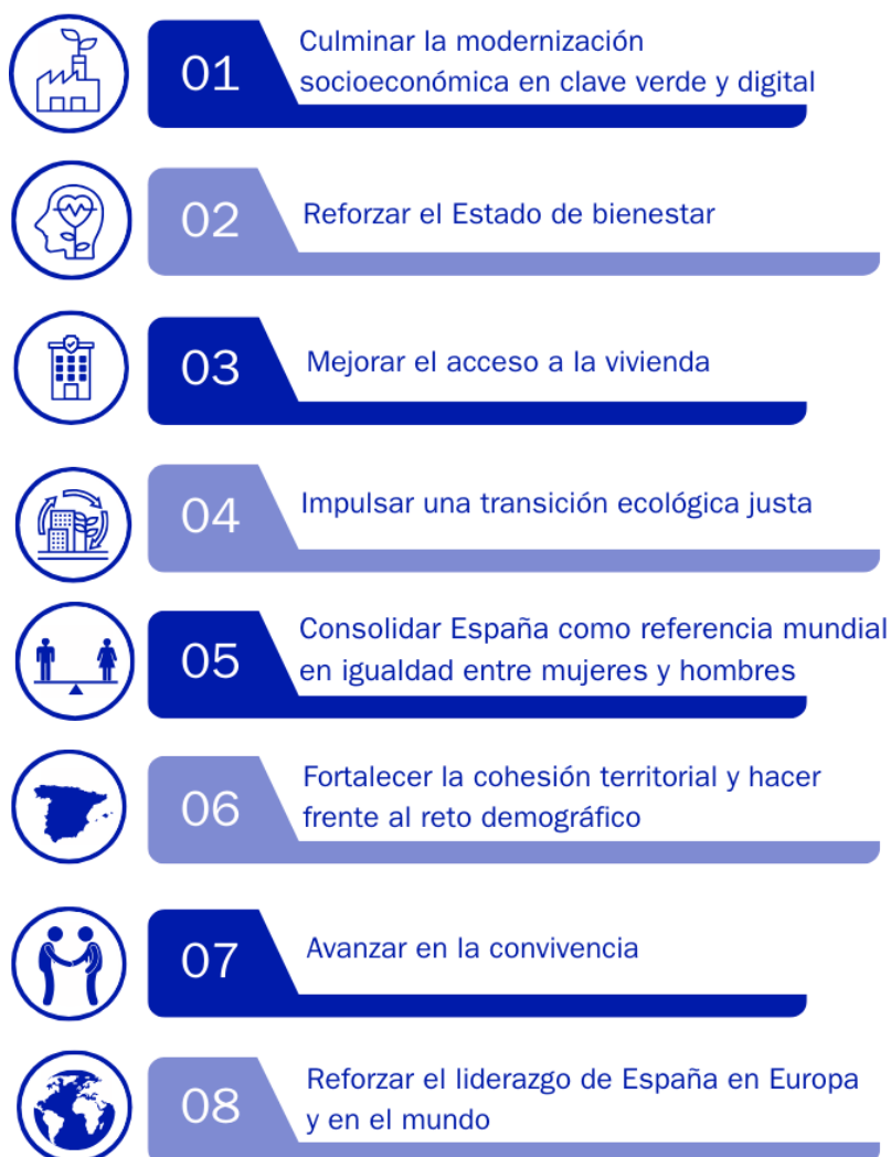
Figura Dos. Líneas estratégicas de la rendición de cuentas Cumpliendo .

Por otro lado, los compromisos han sido asignados a los distintos departamentos ministeriales responsables de su desarrollo y cumplimiento, y han sido validados por éstos.