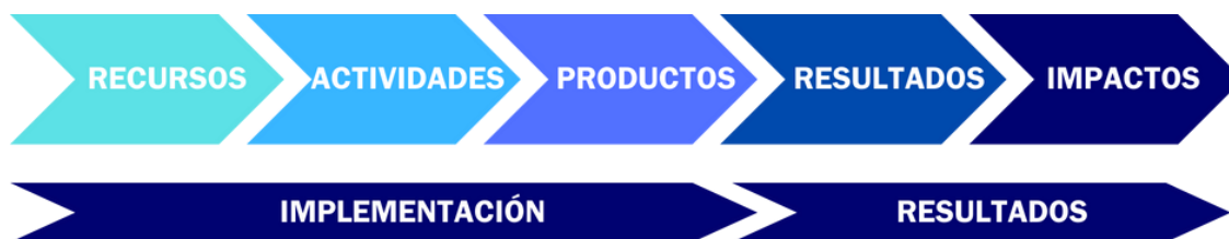
Figura Seis. Cadena de resultados.

Los compromisos tienen una distinta casuística en cuanto a la posible medición de sus resultados e impactos.